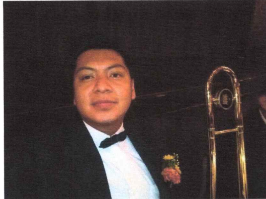
Foto tomada antes de iniciar la grabación