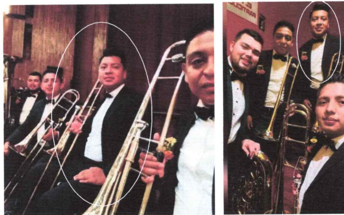
Fotos tomadas en los intermedios de cada acto