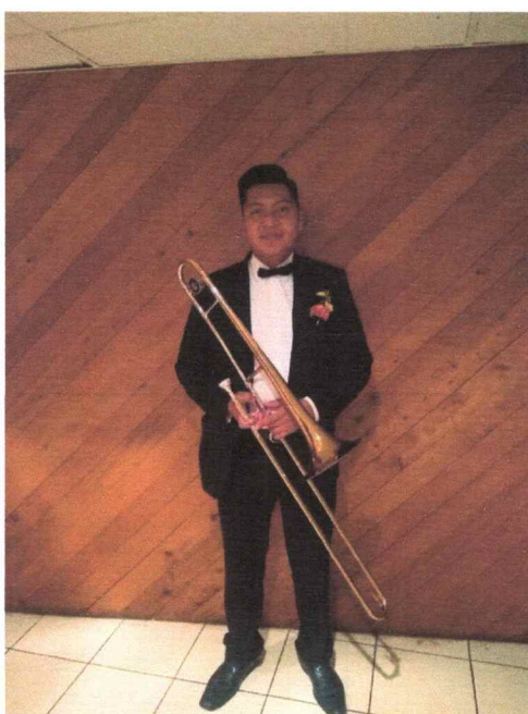
Fotografía tomada al finalizar la presentación

La última obra presentada para la primera temporada fue el día viernes 29 de octubre, teniendo ya en cuenta los horarios, cada integrante del proyecto sabía a que hora estar listo y ya formado listo para entrar al escenario, como ya es costumbre se afinó, se le dio la bienvenida al maestro Sarmientos al entrar a la gran sala, y se inició con el acto uno, teniendo entre cada uno los recesos para el cambio de vestuario de bailarines y elenco de canto, culminando con éxito las presentaciones correspondientes a la primera temporada, dando los agradecimientos al finalizar la obra a todas las personas que hicieron posible el montaje de la ópera, que cabe mencionar, que el primer día de presentación (20 de octubre) fue nombrada patrimonio cultural intangible de la Nación, dada su trayectoria y lo que representa el libreto y la musicalidad para Guatemala.